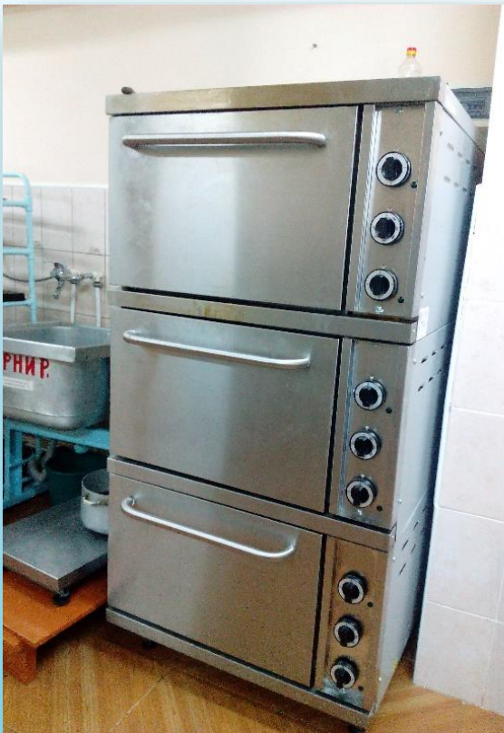
ШКАФ ЖАРОЧНЫЙ – 1935,76