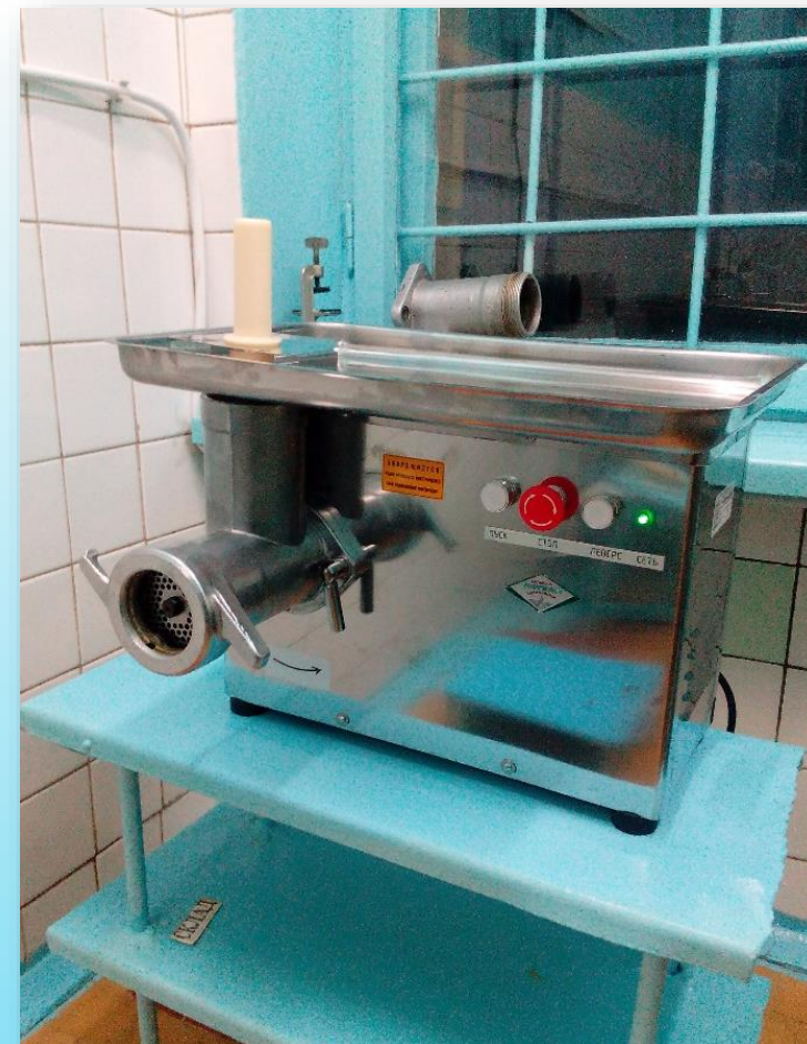
МЯСОРУБКА – 999,12