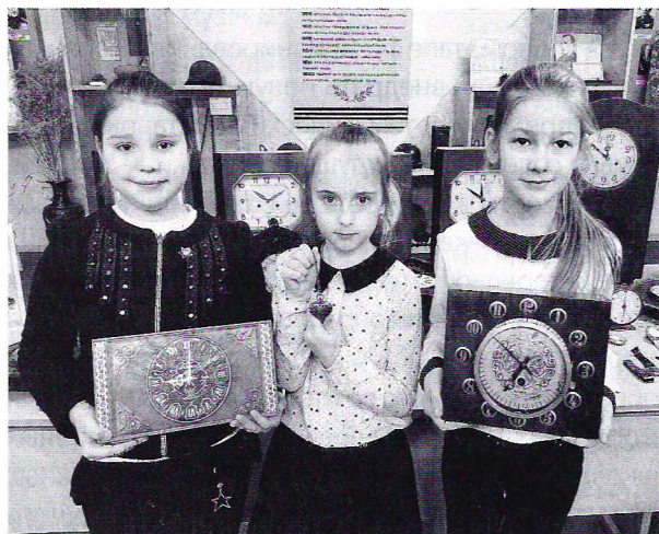
Музейные предметы в наших руках

На выставке было представлено более 700 самых разнообразных календарей по разным темам, где особое внимание уделено национальным, государственным праздникам, памятным датам. На многих календарях изображены белорусские пейзажи, демонстрирующие красоту природы нашей страны, а также памятники архитектуры и народного зодчества, являющие многообразие архитектурных форм и композиций. Многие календари-экспонаты,