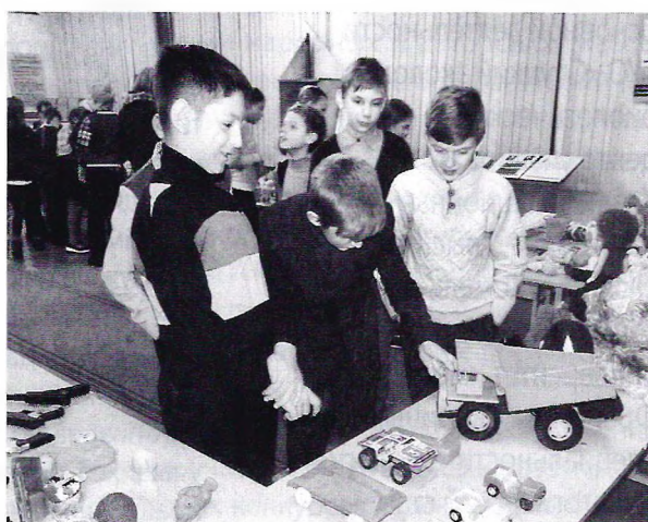
Приобщаемся к познанию